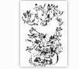
絵画 瀬口 承飛 「未来の世界はまだ見えていない」