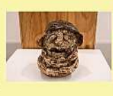
立体作品 松山 和徳 「未来の世界はまだ見えていない」