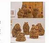
立体作品 茅野 大輔 「未来の世界はまだ見えていない」