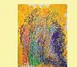
絵画 橋本 寛輝 「未来の世界はまだ見えていない」