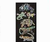
絵画 冨田 昌風 「未来の世界はまだ見えていない」