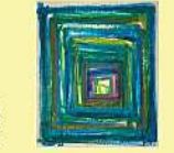
絵画 古武 楓方 「未来の世界はまだ見えていない」