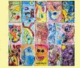
絵画 COCOLO 「未来の世界はまだ見えていない」