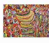
絵画 山口 法幸 「未来の世界はまだ見えていない」