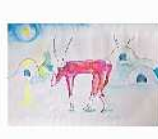
絵画 鏡川 明子 「未来の世界はまだ見えていない」