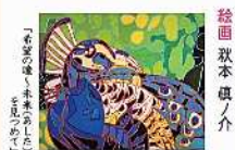
絵画 萩本 健ノ介 「未来の世界はまだ見えていない」