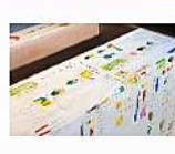
立体作品 岡田 兼巳 「未来の世界はまだ見えていない」