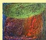
絵画 萩本 健ノ介 「未来の世界はまだ見えていない」