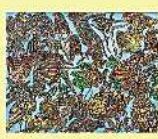
絵画 大原 真一 「未来の世界はまだ見えていない」