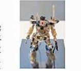
立体作品 MICKU 「未来の世界はまだ見えていない」