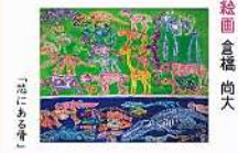
絵画 倉橋 尚大 「未来の世界はまだ見えていない」