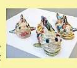
立体作品 千田 和 「未来の世界はまだ見えていない」