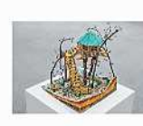
立体作品 乙なボン 「未来の世界はまだ見えていない」