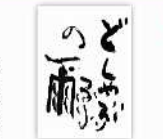
書道 N 「未来の世界はまだ見えていない」