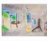
絵画 近藤 未来 「未来の世界はまだ見えていない」